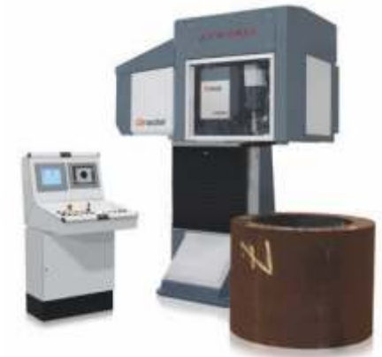
Qradial 60 kg - 3000 kg