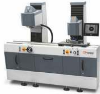
Qsolution TESTPOINT PREPARATION