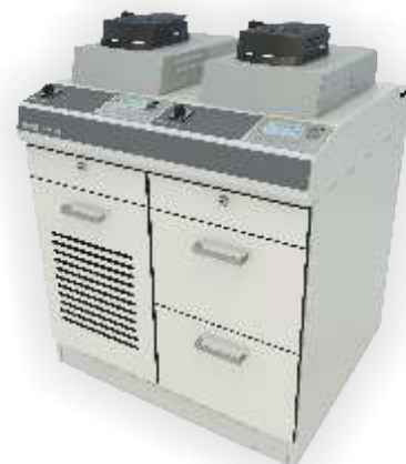
SYSTEM LAB OPAL