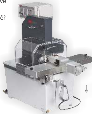
PÁSOVÉ PRECIZNÍ PILY EXAKT

Diamantové pásové precizní pily pro dělení prakticky čehokoliv. Vysoce přesné diamantové pásové pily EXAKT 300, 310 a 311 se používají k přesnému řezání téměř jakýkoliv materiálů a sloučenin