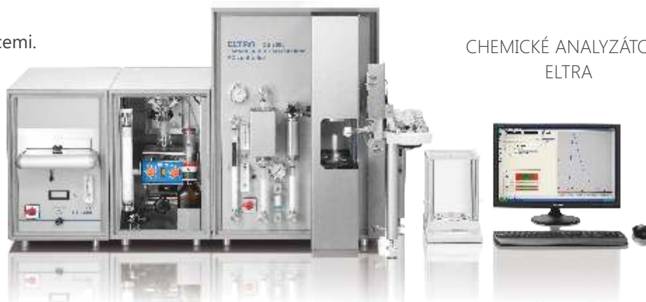
CHEMICKÉ ANALYZÁTORY ELTRA

Elementární analyzátor pro širokou škálu vzorků a koncentrací